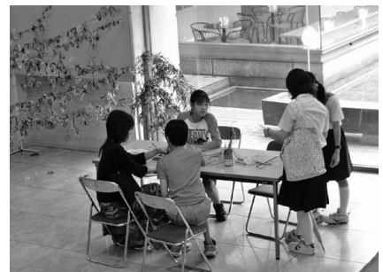
モールを使って七夕かざり