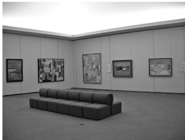
コレクション展 郷土作家の風景画