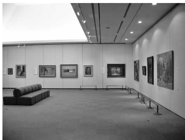
コレクション展 近現代の郷土ゆかりの画家