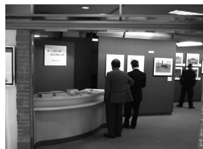
受賞記念写真展（東京展）