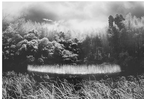
大賞作品 永富博人「光景」