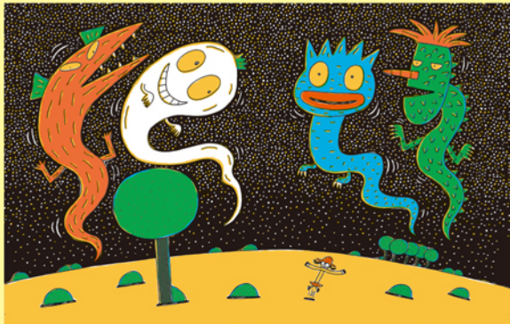
「おさんぽトコちゃん トコトコ」2007年 教育画劇