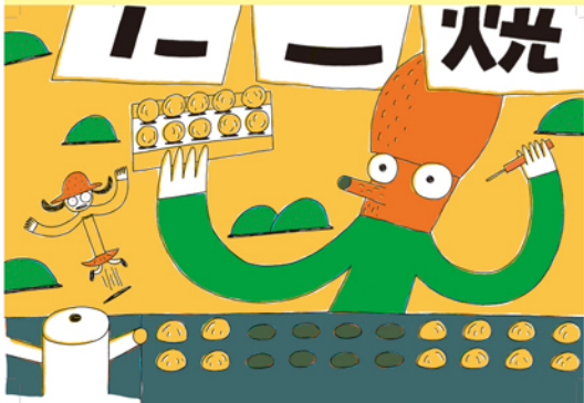
「おさんぽトコちゃん トコトコ」2007年 教育画劇