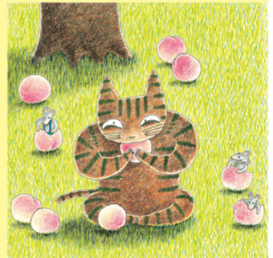
「にゃーご」1997年 鈴木出版