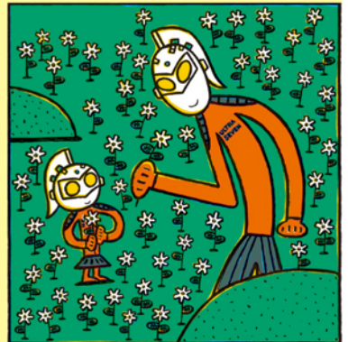
「パパはウルトラセブン」1999年 学研教育出版 ◎宮西達也 ◎円谷プロ

次回展覧会のご案内 谷川俊太郎 絵本★百貨展 9月27日(金)~11月24日(日)