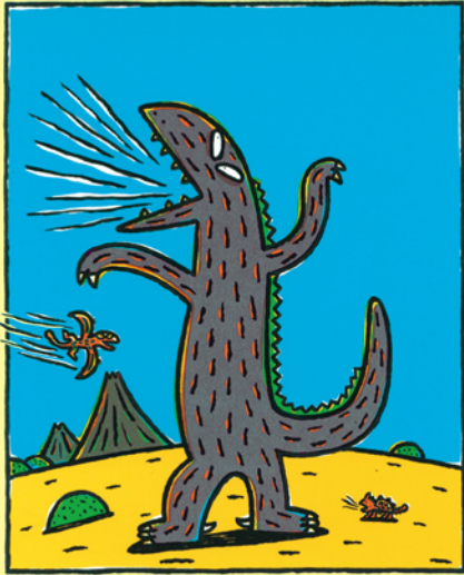
「おまえ うまそうだな」2003年 ポプラ社

絵本作家・宮西達也は、夢や希望、そして何より「優しさと思いやり」を子どもたちに伝えたいと、40年にわたり絵本を作り続けています。