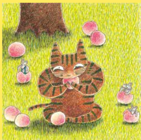
『にゃーご』 1997年 鈴木出版 ©宮西達世

絵本『にゃーご』に登場するのは、ねこと、まだねこの怖さを知らない小さなねずみたち。ねずみたちはねこを誘って桃を取りにでかけます。桃を食べ終えたねこは、ねずみを食べようと怖い顔で「にゃーご」と叫びますが、無邪気なねずみたちはそれをあいさつだと勘違いし、お土産まで渡して、ねこの心を雪解けのように解かしていきます。