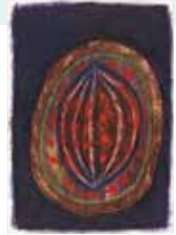
「果実」1961年 クレヨン、水彩、ペン、削り・紙