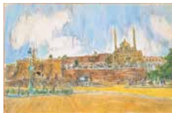
「カイロ風景」1950年代 水彩・紙

深海に光っている真珠のようでした。」と語っています。旅の中で彼は、ベネチアの風景を数多く描きました。