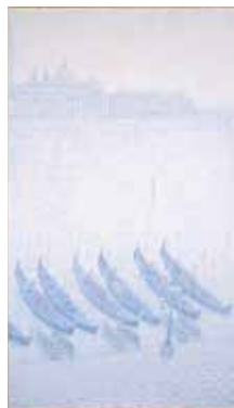
「冬ざれ」1975年 油彩・キャンバス

深海に光っている真珠のようでした。」と語っています。旅の中で彼は、ベネチアの風景を数多く描きました。