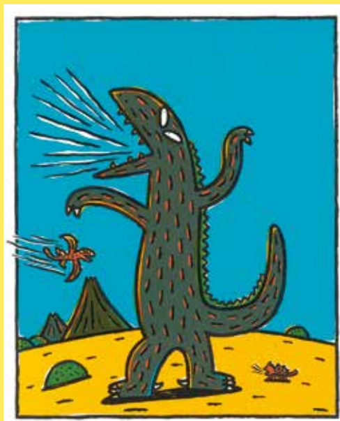
『おまえ うまそうだな』 2003年 ポプラ社