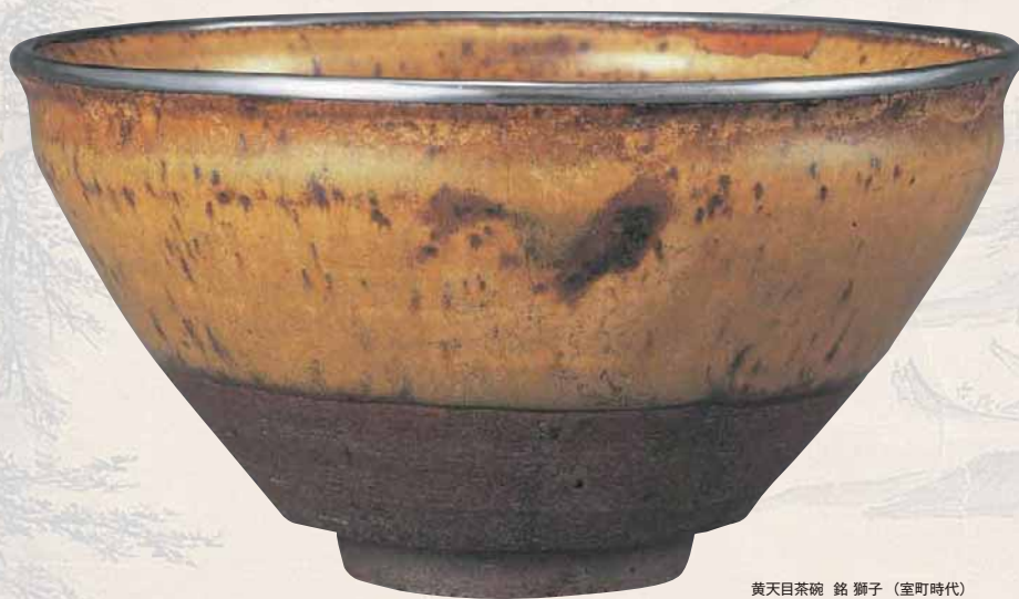
黄天目茶碗 銘 獅子 (室町時代)