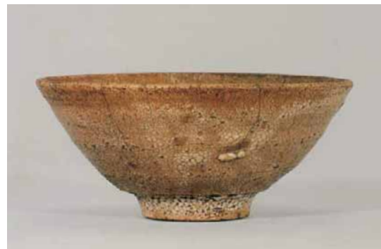
井戸茶碗 銘 奈良（朝鮮・朝鮮王朝時代）重要美術品

今回は当館初の茶道具展となります。夏の風とともに「一期一会」の気持ちが入められた茶道具の1つ1つが、あなたとの出会いを心待ちにしています。