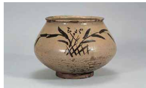
徳山津葦文水指(桃山時代) 重要文化財