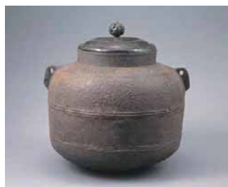
古天明菊水釜(室町時代) 利休所持