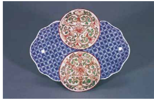
色絵唐花丸文菱形皿 鶴島（江戸時代前期）