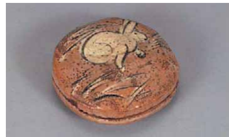
赤楽兔文香合 本阿弥光悦(江戸時代初期) 重要文化財