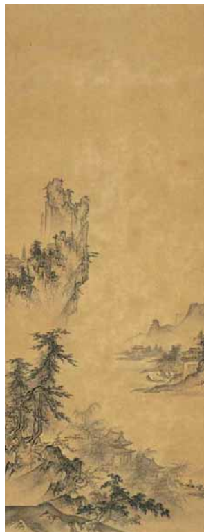
山水図 伝周文筆(室町時代) 重要美術品