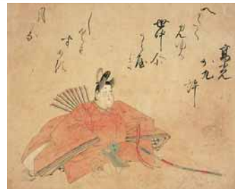
《三十六歌仙図 高光》 岩佐又兵衛 江戸時代前期