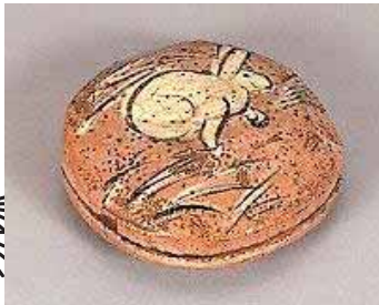
《赤楽兎文香合》 本阿弥光悦 江戸時代初期 重要文化財