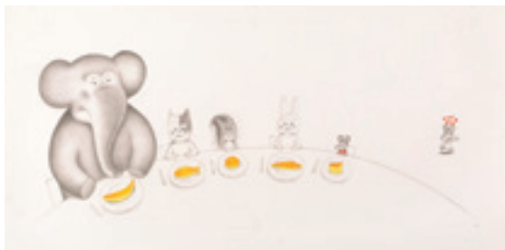
「ねずみくんの絵本」シリーズの原画やスケッチが集結！

選りすぐりの名場面を、貴重な原画やスケッチで展示します。また、なかえよしをが構想し、上野紀子が描き出したシュルレアリスムの油絵「少女チコ」シリーズや、ふたりの絵本作りの原点『ペラペラの世界』の原画も展示。