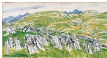
「秋吉台(春)」1960年 油彩・キャンバス