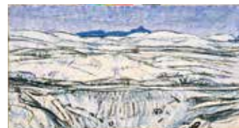
「秋吉台(雪)」1960年 油彩・キャンバス

*対談「この道しかない、この道を歩く」より『尾崎正章展』図録(発行 新南陽市) 参考:『周南市制50周年記念 尾崎正章展』図録(発行 周南市美術博物館)