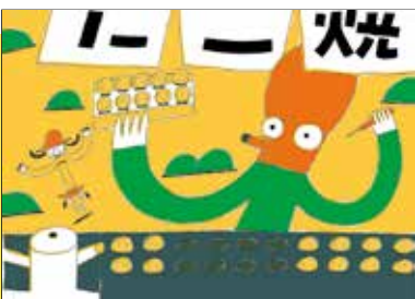
『おさんぼトコちゃん トコトコ』 2007年 教育画劇 ©宮西達也

ほかにも様々な絵本の原画やアイデアスケッチ、ラフなども展示します。筆遣いや作品ごとの描き方の違いなどにもぜひご注目ください!