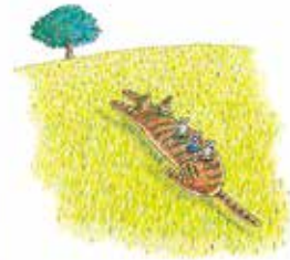
『にゃーご』1997年 鈴木出版 ©宮西達也