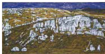
「秋吉台」1960年 油彩・キャンバス