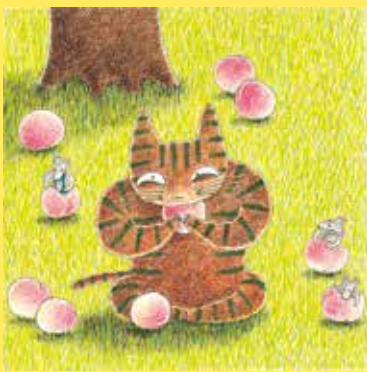
『にゃーご』 1997年 鈴木出版

「みんなに楽しんでもらいたい!」という思いから、絵本創作のかたわら、絵本の原画展、映画の原作脚本執筆、国内外での講演会やサイン会など、絵本から広がる様々な活動も精力的に続けています。地元・静岡県三島市に開いたギャラリーではできる限り店番を務め、読者との交流を大切にしています。