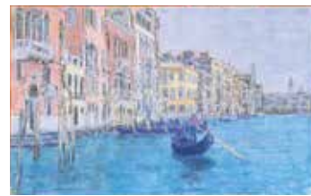
「ベニス風景」1950年代 パステル・紙

深海に光っている真珠のようでした。」と語っています。旅の中で彼は、ベネチアの風景を数多く描きました。