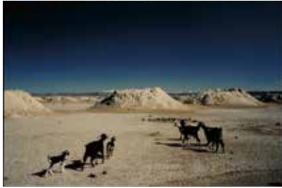
モロッコ(「異郷好日 世界の旅」)

この写真は「青空」とひとこと言ってよいのかと迷うほど、水色から藍色まで、青のグラデーションが写し出されています。写っていない部分の空も、どこまでも高く広いのだろうと想像させる一枚です。