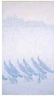
「冬ざれ」1975年 油彩・キャンバス