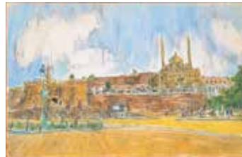
「カイロ風景」1950年代 水彩・紙