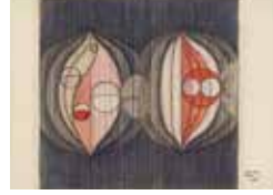
「くろみ」1961年12月3日 クレヨン、水彩、ペン・紙

「実」をイメージした2つの作品を見比べてみると、まどさんが抽象画を描きながら、イメージを広げていった過程もうかがえます。