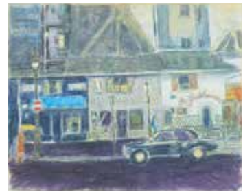
「外国風景4」1960年代 水彩・紙

1962(昭和37)年に尾崎は渡欧し、フランスやイタリア、スペインなどのヨーロッパ各国やエジプトを一ヶ月半かけて周遊しました。50歳の頃でした。彼は著書『初昔』*のなかで「美術巡礼の旅をふり返ってみると、パリのルーブルもロンドンのナショナル・ギャラリーも質も数も最高のものではありませんが、もう一度行くことができるなら、私はやはりプラドとウフィチを選ぶでしょう。(中略)私の求めたものは中世が生きている街角であり、いまなお森厳に生きつづけているグレコや、そしてルネッサンス美術でした。それは現代の