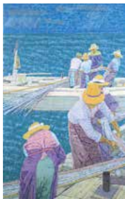
「瀬戸内のいわし網漁夫」1970年 油彩・キャンバス

注1)『美術新論』1933年1月号(美術新論社)より 注2)『尾崎正章展』図録 1990年(発行 新南陽市)P.6より