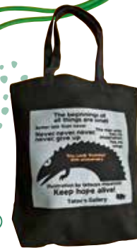
トートバッグ(大) ティラノ 黒 (2色摺 ティラノ20周年) 2,200円