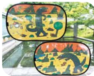
カーシェード2枚組 ティラノ 1,800円