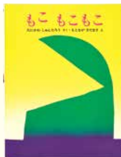
『もこもこもこ』(絵:元永定正) 1977年 文研出版