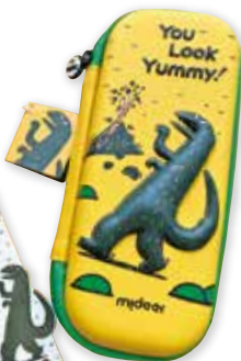
ペンケース ティラノ(黄色) 2,400円