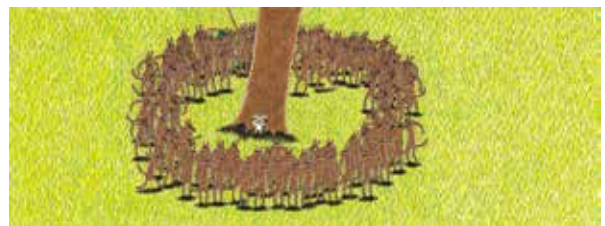
『ぶたくんと 100ぴきのおおかみ』(1991年 鈴木出版) ©宮西達也

『ぶたくんと 100ぴきのおおかみ』(右図)(1991年 鈴木出版)だよ。おおかみを100匹描くのがとても大変だったそうだよ。数えられるかな? 企画展では、この絵本の原画も展示しているのでぜひ観に来てね。