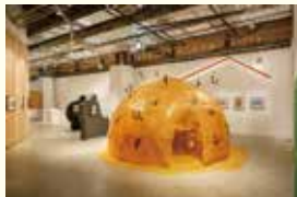
東京会場 展示風景