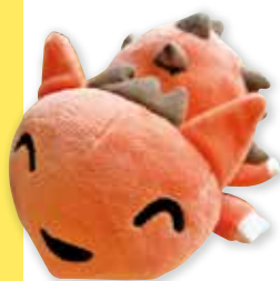
ぬいぐるみ ウマソウ 2,900円