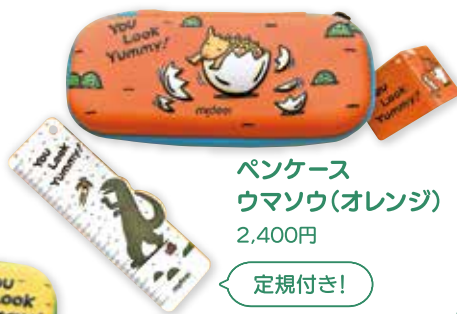
ペンケース ウマソウ(オレンジ) 2,400円