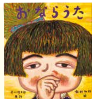
『おならうた』(絵:飯野和好) 2006年 絵本館