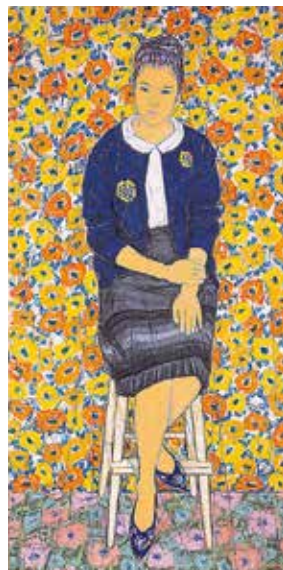
「花模様」1964年 油彩・キャンバス