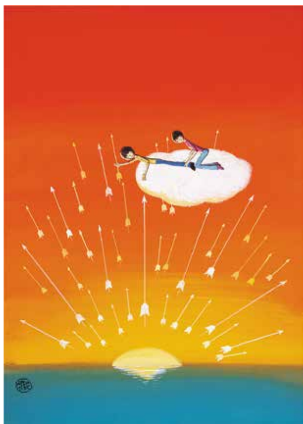
「詩とメルヘン」1978年8月号表紙絵 「ついにぼくは夜明けの光の矢をにぎったぞ」

*身体障害者手帳、療育手帳、精神障害者保健福祉手帳、戦傷病者手帳等をご持参の方とその介護の方は無料