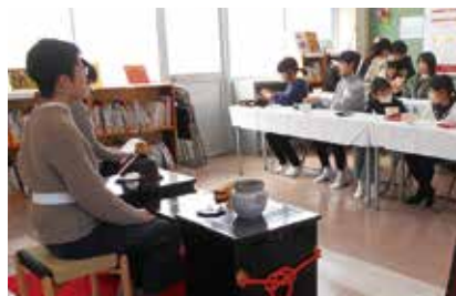
発表会(こども茶会)の様子