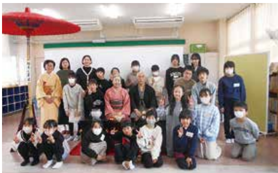
発表会(こども茶会)の集合写真

A. 裏千家茶道を学んでいます。準備から片付けまで子ども達とスタッフが一緒に行う事で、茶道の点前作法を学ぶだけでなく、礼儀や思いやり、物を大切にすることを育むことを目的に活動しています。2月の発表会(子ども茶会)では、子ども達がお点前をします。お茶を点てたり、お運びをしたりと頑張っている姿を、保護者や地域の方々に見ていただく機会を作っています。