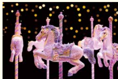
お菓子のメリーゴーラウンド

※上記それぞれの展覧会は、都合により会期、内容等が変更になる場合があります。ご了承ください。