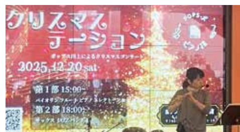
昨年のクリスマスイベントにて演奏