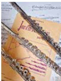
みんなでアンサンブル しましょう♪

活動は月3回、日曜日の13:00～15:00で、周南市文化会館練習室3にて行う予定です。文化会館は令和9年2月から休館に入るので、それ