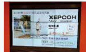
徳山駅前図書館入口 9面モニター