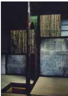
「有楽苑 如庵 有楽窓」

国宝「如庵」は、織田信長(1534-1582)の弟、織田有楽(1547-1621)によって、1618(元和4)年頃、京都・建仁寺内に建てられました。幾度か移築され、現在は愛知県犬山市にあります。有楽窓を始めとする様々な意匠の窓、斜めに配置された壁など、武将であり茶人としても高名であった有楽好みの独創的で斬新な造りとなっています。