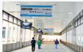
南北自由通路 (ぞうさんのさんぼみち)