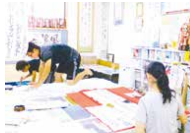
コンクール錬成会の様子