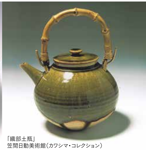
「織部土瓶」笠間日動美術館(カワシマ・コレクション)