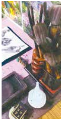
小学4年生以上が使用する書道道具

A. 日頃は競書誌「玄游」で漢字・かな・近代詩文・実用・ペンを学んでいます。展覧会にも出品しています。教育部(中学生以下)は、毛筆と硬筆はもちろん、象形文字を多様な文房四宝(筆、墨、紙、硯を指します)を駆使して書作を行っています。また、子供達は全員全国展に挑戦し、意欲を高めてもらっています。通年、書に関する様々な行事を開催しており、楽しめます。例えば、年始には全紙(約畳一畳サイズ)に大きい筆で書き初め大会、夏休みお楽しみ会、篆刻教室、年末には羽子板に揮毫し、羽根つき大会などの行事があり、仲間と楽しみながら活動しています。また、毎年、書き初め(大作)の頃には、自発的に作品を仕上げている生徒さんもおられ、成長されている姿を見せてくれています。