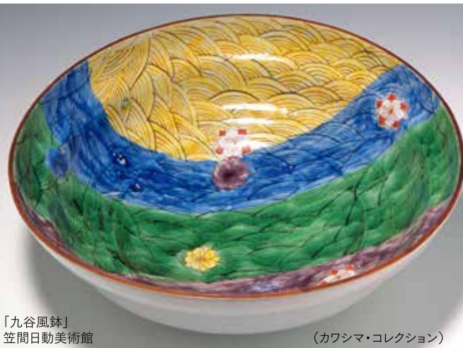
「九谷風録」笠間日動美術館