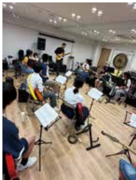
指導スタッフの模範演奏を 食い入るように見つめる部員。

POPS-K音部では課題曲や自由曲を、バンドアンサンブルで演奏するための練習や、バンドマンとして身につけておかなければならない知識、技術、マナーを習得する活動を行います。