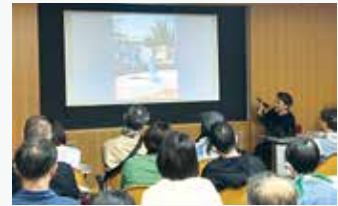
トークショーの様子