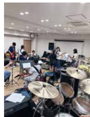
バンドごとに分かれて ミーティングしています。