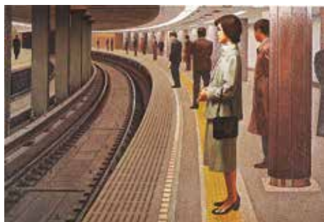
寺井力三郎「地下鉄ホーム」1987年 油彩・キャンバス