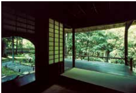
「西芳寺 湘南亭 内部と前庭」

ほの暗い茶室、日の光に照らされる庭園の木々、木漏れ日があたる露地の苔が対照的に写し撮られています。