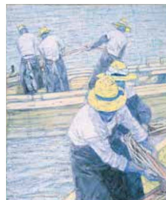
「いわし網漁夫習作」1969年 油彩・キャンバス

尾崎正章は、小学4年生頃から福川で育ちました。進学や療養のため一時故郷を離れますが、30代で帰郷し、生涯この地で暮らしました。福川漁港の漁師たち、思い出の中の塩田、工場地帯など、尾崎がとらえたふるさとの風景や、生き生きと働く人々の姿をぜひご覧ください。