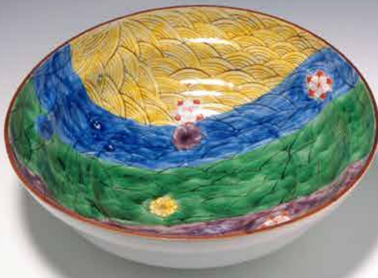
笠間日動美術館 (カワシマ・コレクション)

【郷土美術資料館・尾崎正章記念館】山口県周南市富田永源 (レゾナック永源山公園内) (0834-62-3119) http://s-bunka.jp/kyoubi/